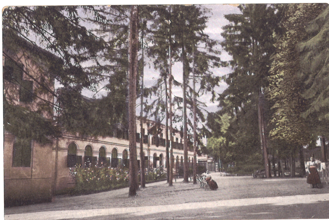
Zeleň pri hoteloch Buda a Pest okolo roku 1903

V roku 1863 postavili klasicistickú budovu hotela Pest. Hotel v roku 1886 vyhorel a pri následnej renovácii získal súčasnú podobu. V medzivojnovom období bol známy ako hotel Praha a k dispozícii mal 34 väčšinou dvojľôžkových izieb. V budove bola ordinácia šéflekára kúpeľov a miestnosť s čítárňou, knižnicou a klavírom. Hotely Hungária, Buda a Pest boli prepojené krytou ochodzou na úrovni prvého poschodia a bol z nich pohodlný prístup do balneoterapeutickej budovy. Počas Slovenského národného povstania kúpeľné budovy slúžili ako vojenská nemocnica. Po druhej svetovej vojne boli zaradené do siete štátnych kúpeľov a prešli na celoročnú prevádzku. Staršie budovy asanovali a postavili nový Kúpeľný dom.