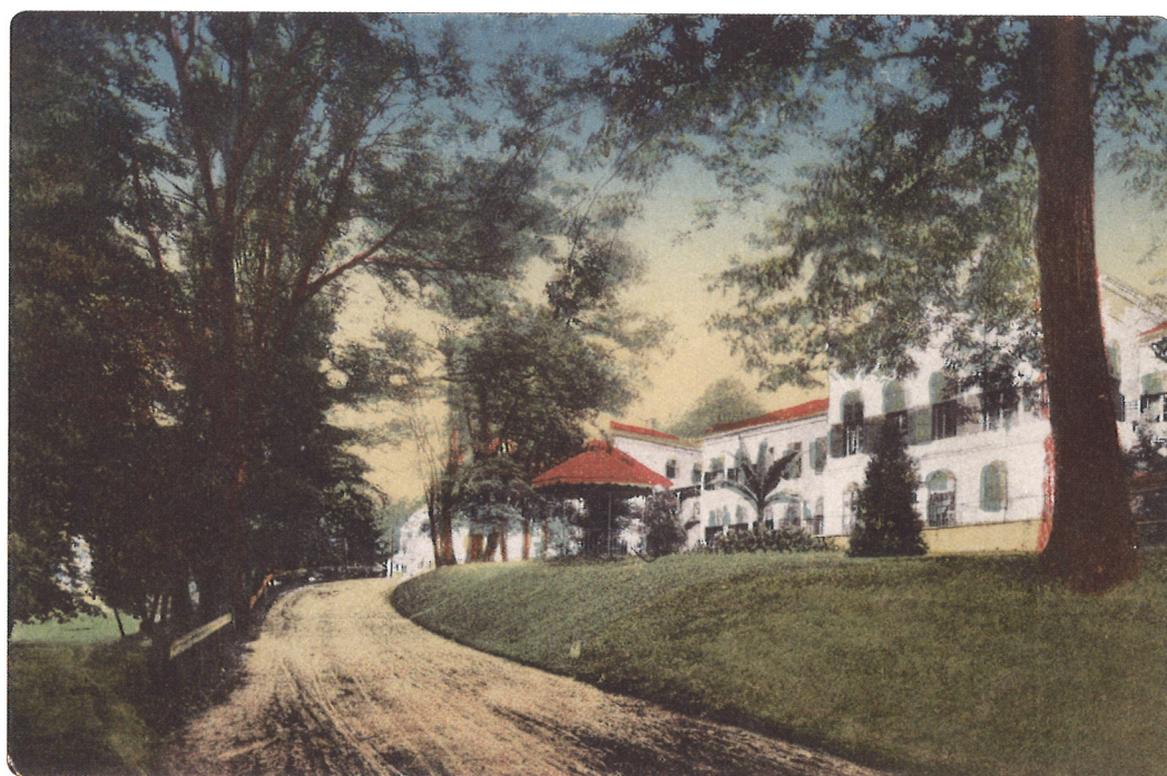
Cesta do centra kúpeľov okolo roku 1906