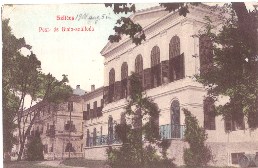
Hotely Buda a Pest okolo roku 1908