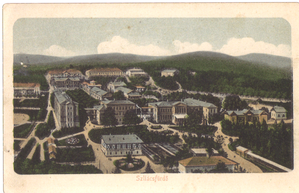
Panoráma kúpeľov okolo roku 1900