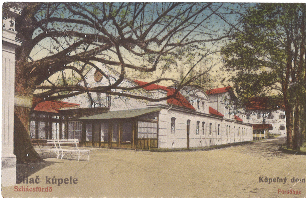
Kúpeľný dom okolo roku 1915